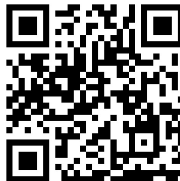
QR Code for Website